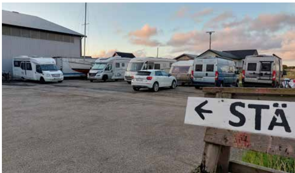
Lugn natt på en av Skillinges ställplatser

Den innehöll skelett från människor och en stenyxa som gravgåva. Idag är det ett populärt besöksmål med stor parkering och café och museum i ett par näraliggande gårdar. Vi tog en fika där och hittade bra natthamn i Skillinge där det fanns tre ställplatser med olika servicegrad.