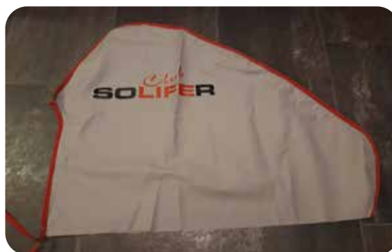
Dragskydd 50:- Frakt tillkommer