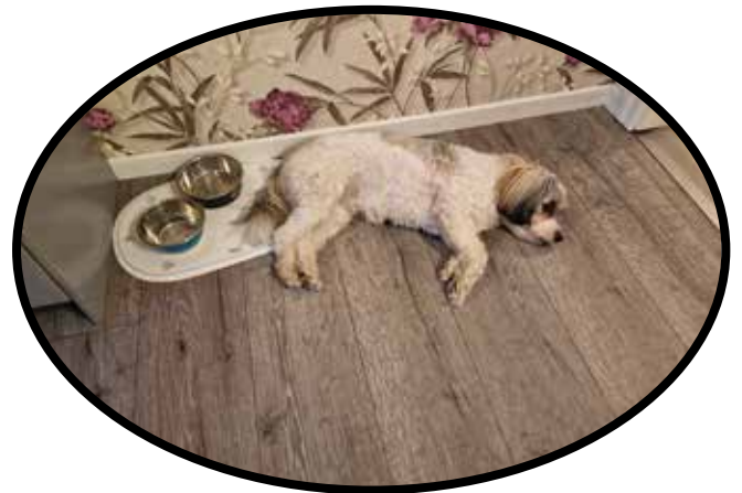
Daisy fick matkoma efter lunchen och stannade hemma.