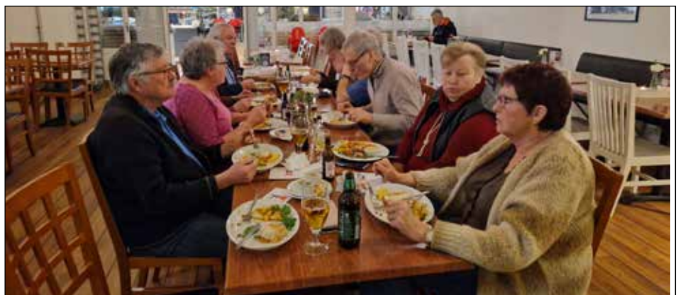
Middag på fredagskvällen