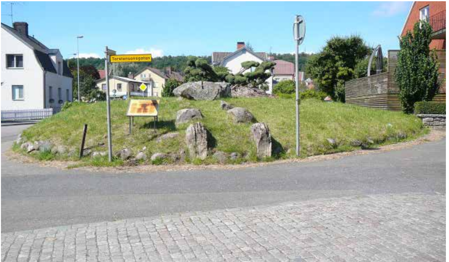
Falköping värnar sina gånggrifter. Bygger vägen runt om.

Korna värmdes säkert gott i bister vinter. Dessa bondestenåldersmänniskor hade också börjat odla lite vete och korn för bröd och gröt och för att kunna tillverka öl, den viktiga drycken att ha till festerna. Och fest hade de nog när dösen stod klar och första begravningen - gravölet! - skulle ske. Hagadösen användes för begravningar i flera tusen år och den låg då i ett öppet landskap nära stranden. När vi nu skulle ta oss dit fick vi lämna husbilen vid en bondgård och gå genom kohagar och skog. Men det var en mäktig syn som mötte oss. Stenar som väggar, en jättesten som tak; hur kunde människor på den tiden hantera stenblock i flertonsklassen?