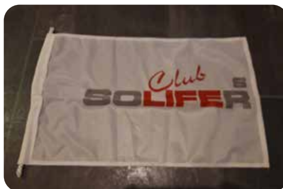
Flagga 50X30 cm 30:- Frakt tillkomer

Ni glömmer väl inte att betala medlemsavgiften.