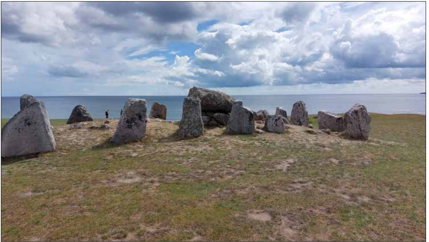
Stenkammargraven Havängsdösen ligger vackert vid skånska kusten.