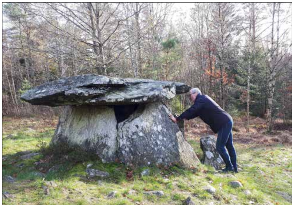
I Hagadösen på Orust har många begravts under århundraden.

Stenbyggena kan också ha varit kultplatser där de tillbad sina gudar och sina förfäder, det finns mycket att fantisera om när man ser byggena. Husbilen stod bra där den stod och efter rundturen passade det förstås bra med ostbuffé hos Falbygdens osteria. Stengravar av typen dösar finns också runt hela Skånes kust så det hade vi i åtanke när vi åkte runt i Skåne förra sommaren.