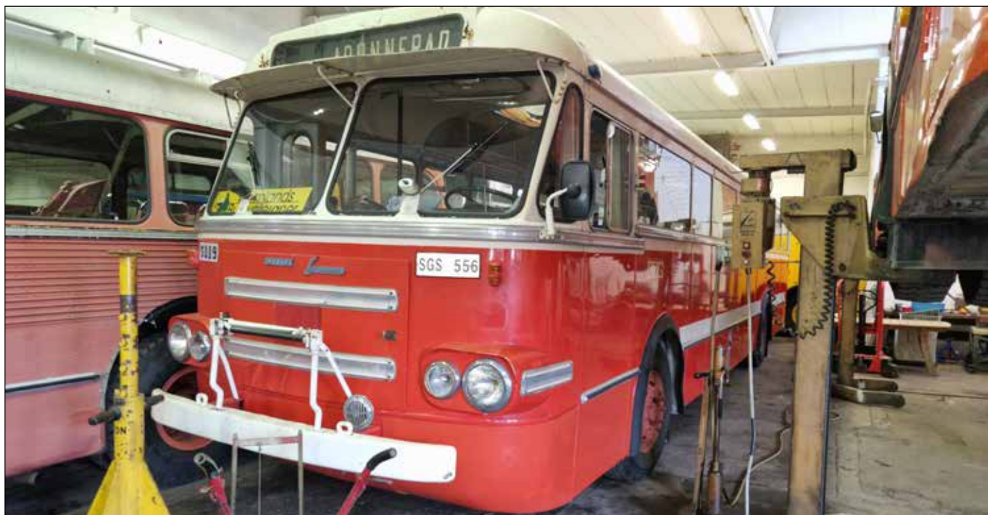
Volvo B 658 från 1957 motor på 150 hk Säfflekaross med 49 sittplatser. Bussen är ombyggd för högertrafik