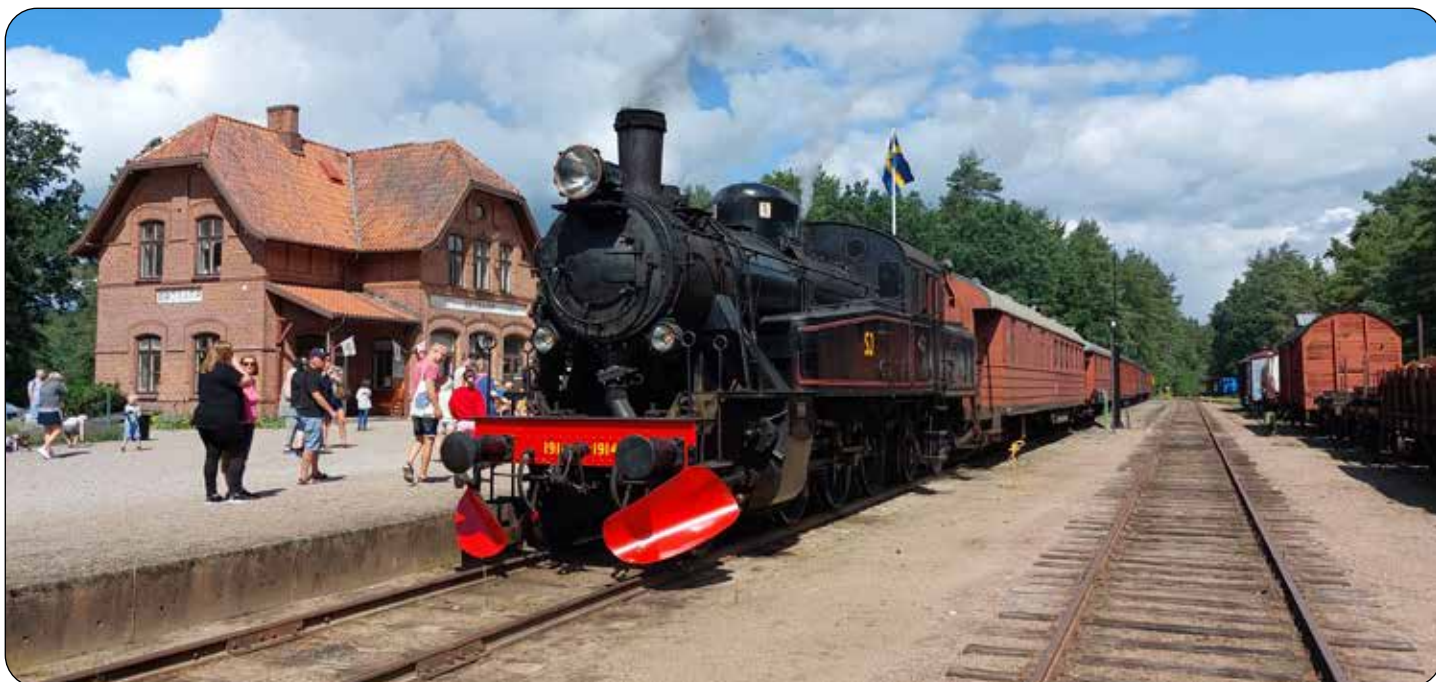
Ovan: Ånglok "1914" byggt 1952, Skånska Järnvägars mest imponerande dragkraft.

Hässleholm är målet. Här finns Sveriges största och finaste modelljärnväg och den är otroligt välgjord som en kopia av stationer i Hässleholms kommun på 1960-talet. Små tåg susade runt, små människor och djur och maskiner bildade små scenerier som fick oss många besökare att förtjust utropa "titta!".