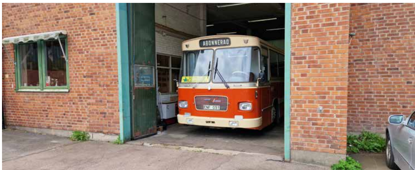
Volvo B58,1969 Med Säfflekaross och turbomatad "Pannkaksmotor" på 290 hk. 73 passagerarer varav 47 sittande.