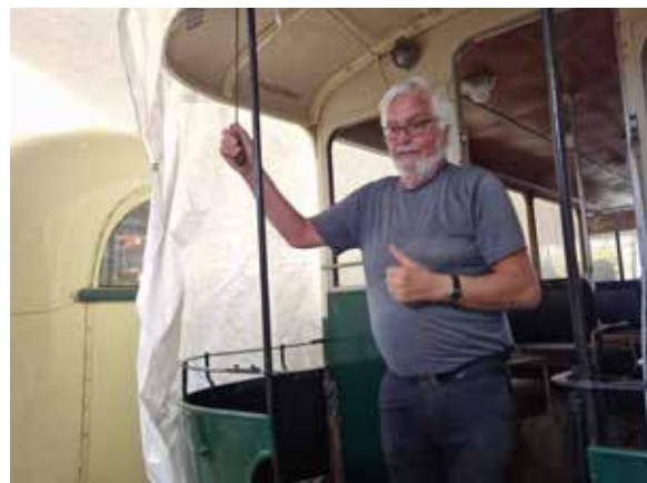
Förarplatsen i Renault TN4H bussen saknade dörrar ingången var bara bak.