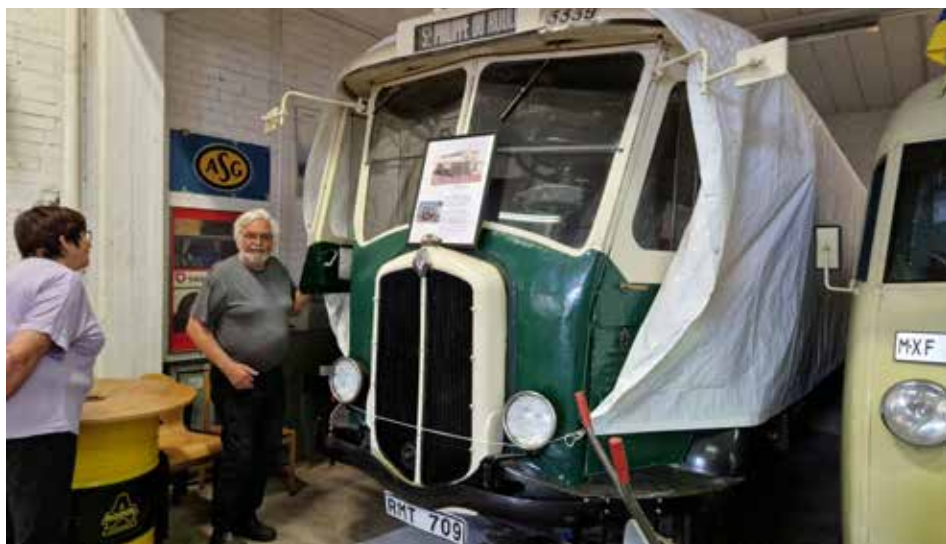
Renault TN4H, 1932. Bussen har sitt ursprung på hästdragen vagn. Förarsätet är den forna kuskbocken. 1936 monterades rutor och dörrar, från början var den helt öppen fram. Motorn är en 6 cylindrig bensinmotor på 58 hk, toppfart ca 40 km/t. 41 sittande passagerare+förare, mekaniker och konduktör

På kvällen blev det en trevlig samvaro med dom.