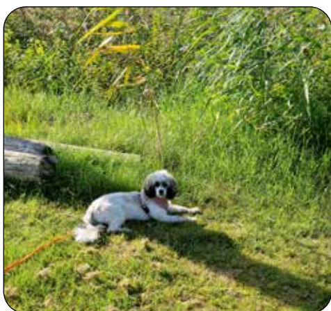
Daisy trivs i Värmland som hon härstammar ifrån