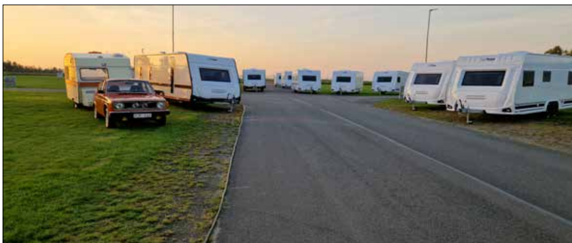
Polarvagnar i solnedgången efter Elmia mässan