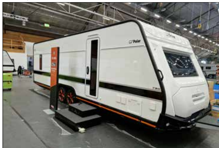
Det har hänt en del på campingfronten