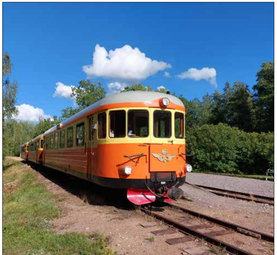
På museijärnvägen Hulfsfred-Västervik får man åka orange-gul rälsbuss från 1950-talet

Kvar blev några få. Till exempel privatägda järnvägen mellan Deje och Hagfors i Värmland som körde godstrafik ända till 1990. En som likt Hulfsfred-Västervik blivit museijärnväg är Wadstena-Fogelsta Järnväg som lades ned 1978 men räddades och numera kör med rälsbussar och dressiner under sommaren.