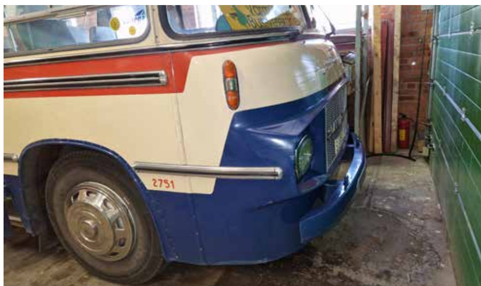
Tv: Scania-Vabis, 1967 med Lierkaross D11 dieselmotor utan turbo på 190 hk. GDG-Turistbuss byggd för Norgeresor, endast 2,35 bred.

Totalt har föreningen 11 bussar i lokalen, så detta är bara ett axplock av samlingen.