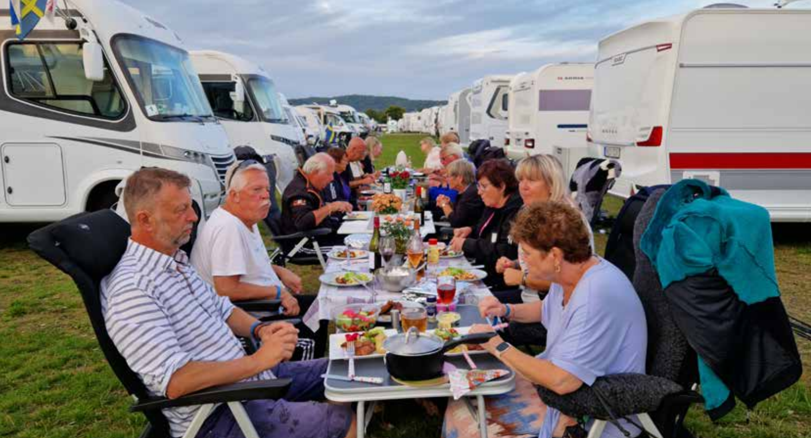
Långbord på fredagskvällen