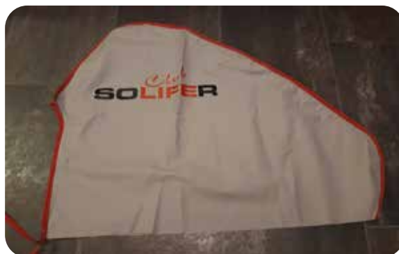
Dragskydd 50:- Frakt tillkommer