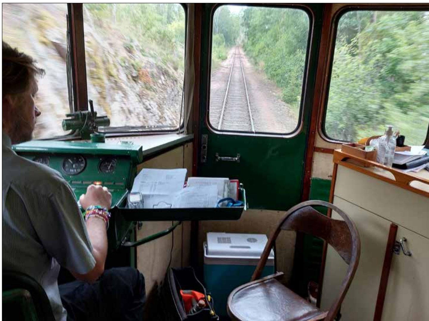
Lokföraren har en spartansk arbetsmiljö i rälsbussen från 1950-talet.

Vi tuffar på mot Västervik mellan granskogar och bergknallar. Här och där några öppna gårdar, några gårdar, en sjöglimt. Rälsbussen vagnar fram i sisådär 60-70 km i timmen, saktar ner och tutar inför obeckade vägövergångar.