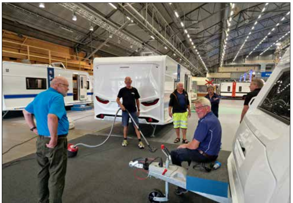
Dammsuga är en avancerad syssla en håller i munstycket och 5 dirigerar.