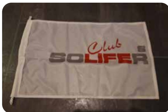
Flagga 50X30 cm 30:- Frakt tillkomer