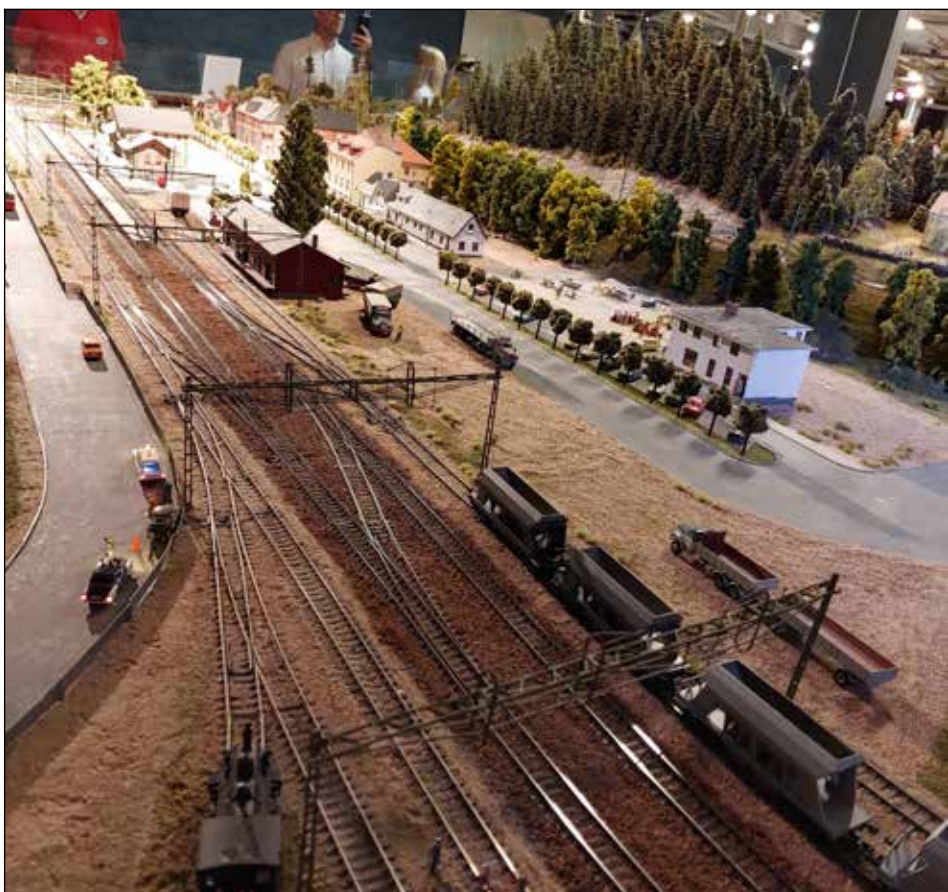
Modelljärnvägen i Hässleholm visar 1960-talets tåg, hus och bilar.

De tillverkades av Hilding Carlssons Mekaniska Verkstad i Umeå och levererades från 1952 och framåt. I lokstallarna finns också några ånglok och motorlok, liksom olika vagnar. Vi passerar några små stationer och hållplatser och är snart framme i Västervik där rälsbussen ansluter till normala järnvägen med normal spårvidd. Färden tillbaka går fint, vi övernattar i Totebo och drar söderut morgonen därpå.