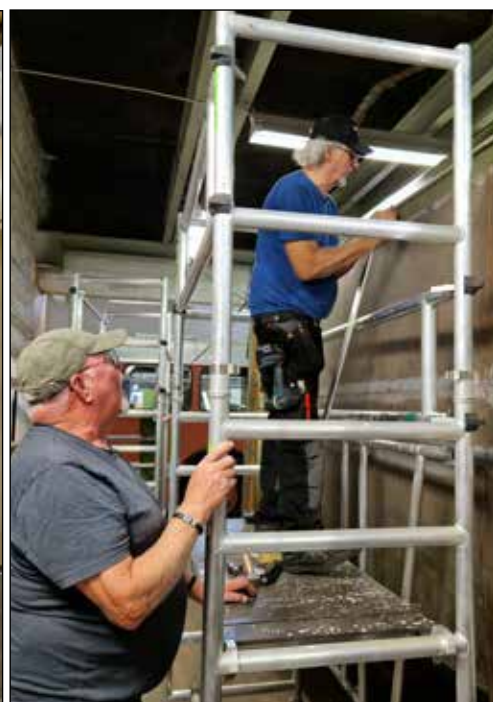
Bosse och lasse monterar lister