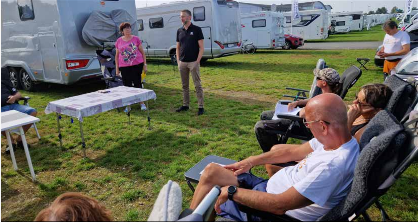
Informationsmöte i gröngräset

På söndag förmiddag ställdes alla Polar husvagnar på plats i montern. Måndag förmiddag åkte vi till Torsvik och besiktade husbilen, nu kan vi åka lagligt ett år till.