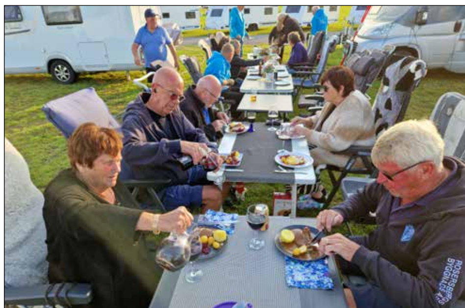
Vi njuter av Dansk fläskstek

Vi kom till Elmia lagom tills alla husvagnar var tvättade. Polarklubb Syd bjöd oss alla i Soliferbyn på dansk fläskstek med rödkål och potatis, väldigt gott.