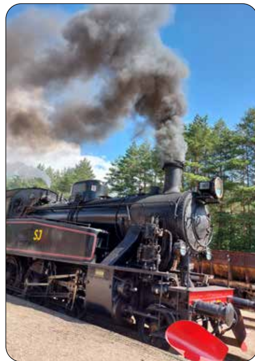
Skånska Järnvägars fina ångtåg lockade många passagerare.