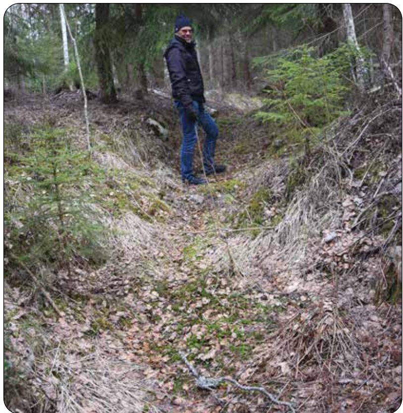
Hålväg: Fötter, hovar och malmslädar har slitit fram en U-formad hålväg från gruvan i Siggebohyttan.

Redan stenåldersfolket rörde på sig, mycket mer och längre bort än man kan tro. Helst ville de använda sina båtar av hudar eller trästockar på havet eller i sjöar och åar. Vattnet var ju slätt och fint, även på isarna vintertid - på land växte lövskogar och snåriga buskar, och det var kärr och sankmarker överallt. Så småningom började stigar växa fram i takt med mer behov av transporter av exempelvis brons, järn och keramik. Redan de gamla romarna kunde bygga vägar. De var stenlagda, raka, för exempelvis trupper av soldater och för transport av mat till hung- riga stadsbor i Rom och Pompeji. I Sverige är de äldsta synbara spåren efter gamla stigar/vägar samtida med romarrikets tjugiga stenvägar, uppåt tvåtusen år gamla. Men inte många stenläggningar syns här, utan de flesta vi ser spår av är så kallade hålvägar där människors fötter och hästars trampande skapat en fördjupning i marken. De har också varit vanliga i stora delar av Europa.