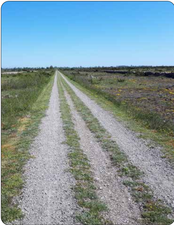
Grusväg trespår: Forna tiders grusvägar var trespåriga. Hästen i mitten, vagnshjulen ytterst.