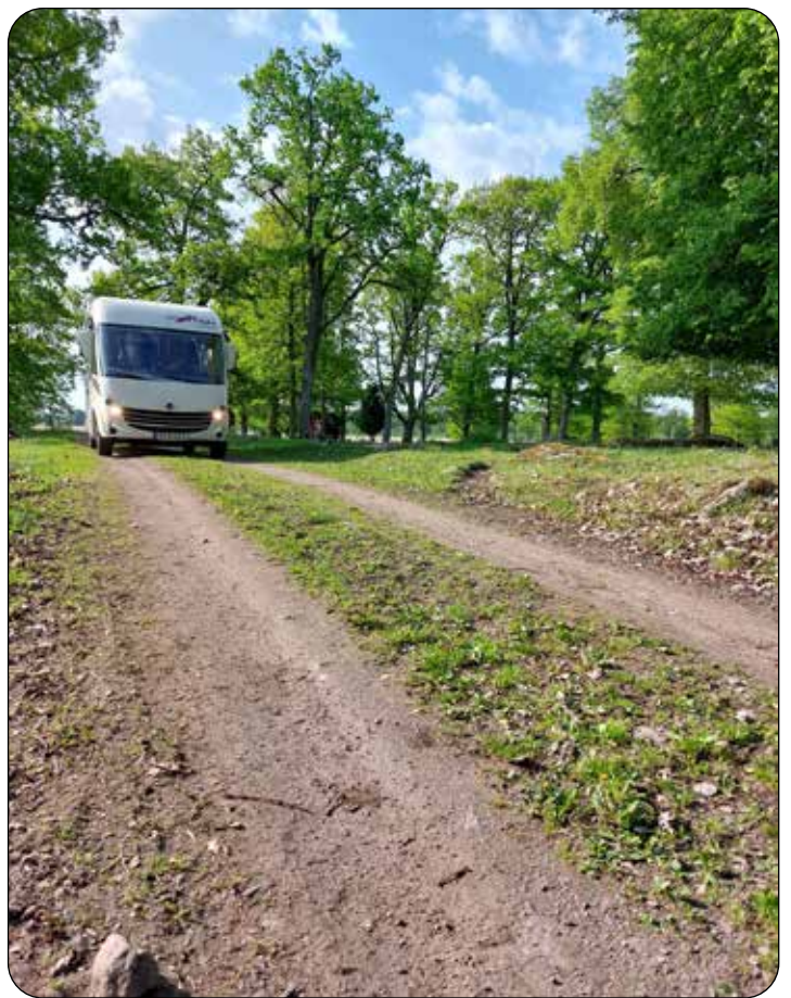
Grusväg: Grusvägar gällde överallt i Sverige från 1600-talet till 1930-talet. Före husbilarnas tid...

Viktiga vägar från 1000-talet och framåt var kyrkstigarna som ibland bildades först som hålvägar. De växte fram överallt när Sverige kristnades och katolska kyrkan krävde ett vägnät till stiftsstad och sockenkyrka; sockenborna var tvungna att ofta besöka gudstjänster i sin kyrka. Det var nog tufft, det kunde vara både en och två mil att gå, bara de rikaste hade häst och kunde rida.