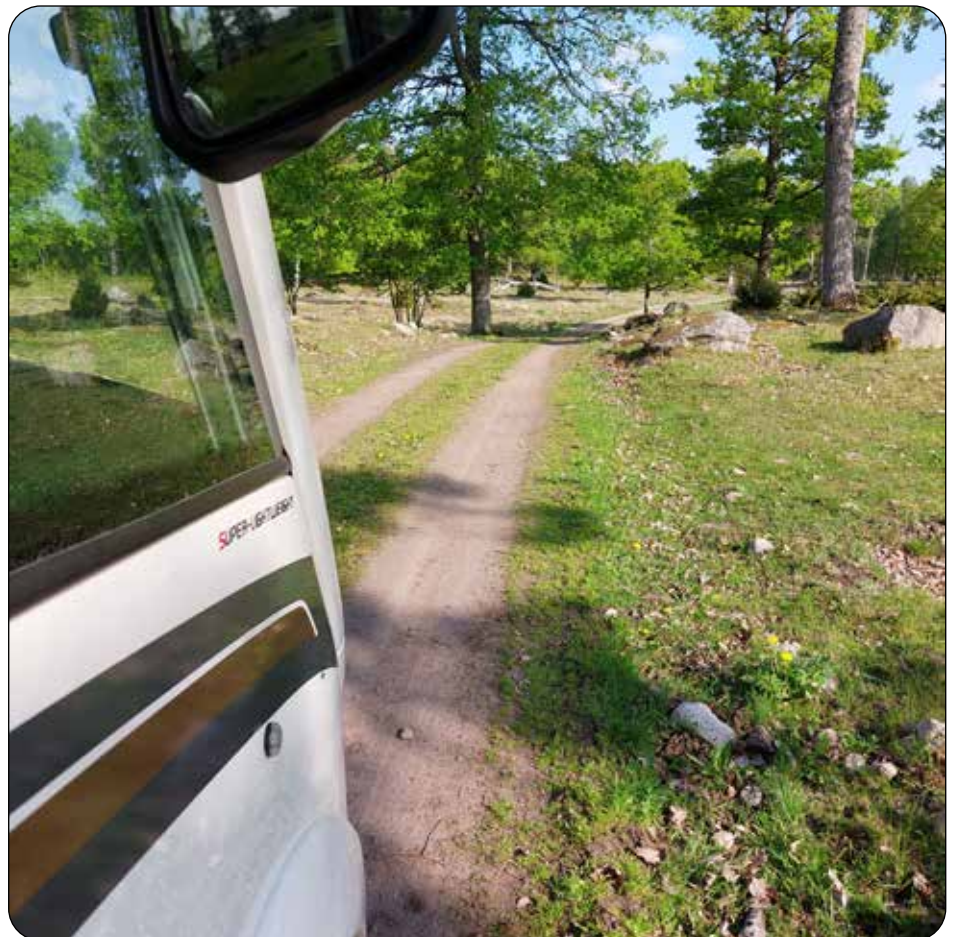
Grusväg smal: Smal väg för smal husbil? Naturreservat vid östra Vänerstranden.

Men det blev bättre på 1200- och 1300-talet då bönderna hade blivit skyldiga att hålla väg och att bygga broar. På 1500-talet kom Gustav Vasa och krävde ännu fler och bättre vägar. Men ännu var det mest ryttare och gående som använde de leriga och söndertrampade vägarna. Vintertid gick det däremot fint med slädar på frusna sjöar och myrmarker. Vagnar blev inte vanliga förrän på 1600-talet, annat än för kungar och rikemän eller för korta sträckor. Vid den tiden kom också en organisering av vägnätet med gästgiverier på "hästmarsch-avstånd" och milstenar, allt styrt av överheten och en statlig byråkrati.