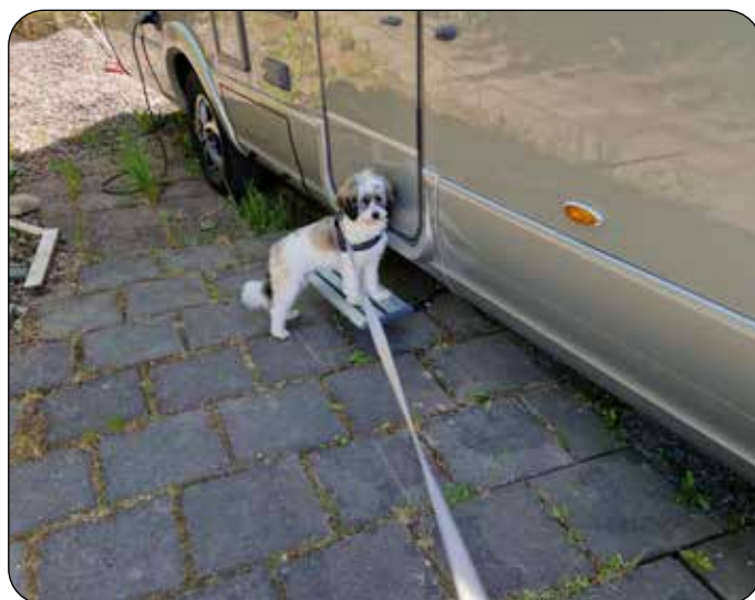
Daisy vill hellre åka husbil än gå på promenad