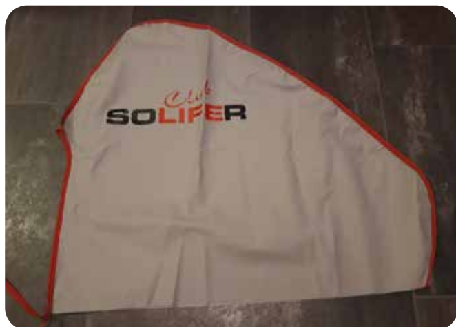
Dragskydd 50:- Frakt tillkommer