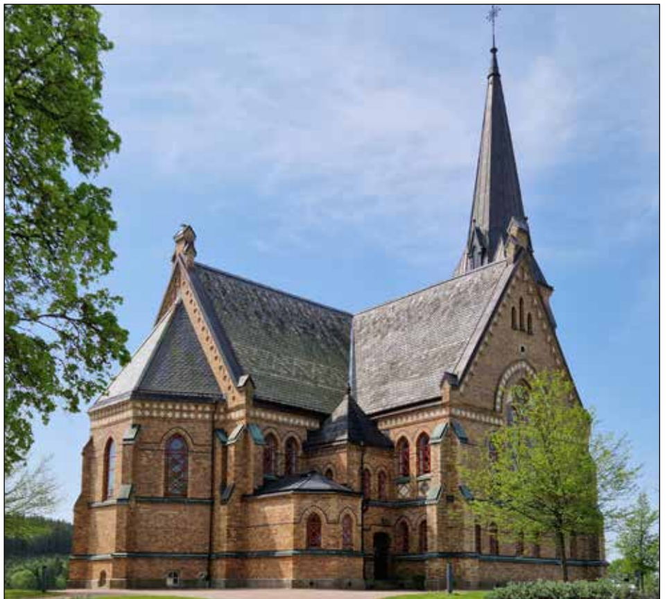
Seglora nya kyrka