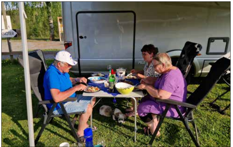
Middag i solskenet

På väg till campingen åker man över Seglorabron en stenvälsbro som är 60 meter lång och 5 meter bred. Den är byggd med 4 stenvälv med en spännvidd av 7 meter var, på uppströmsidan finns dekorativa strömkonor, bron var klar 1860.