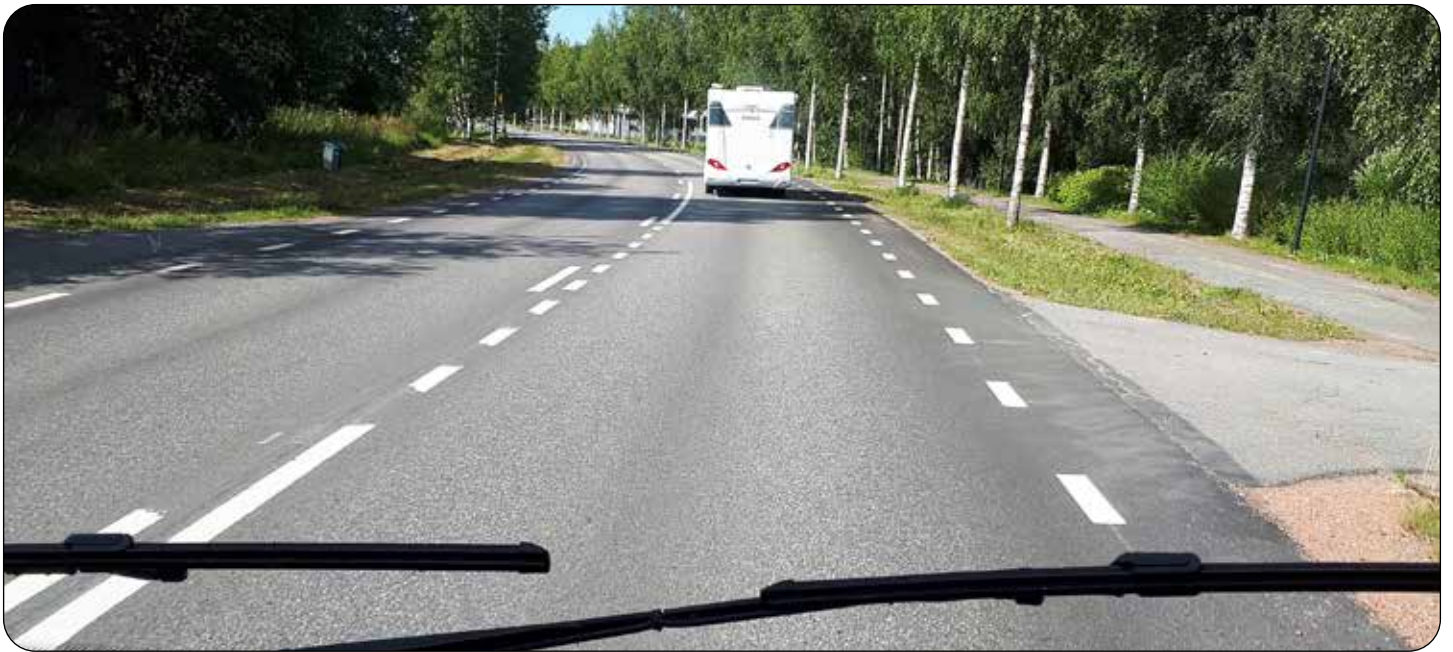
Asfalt 1960: Behaglig färd för oss husbilister med 1900-talets asfalt.