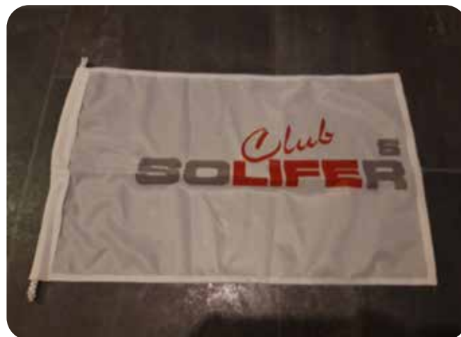
Flagga 50X30 cm 30:- Frakt tillkomer