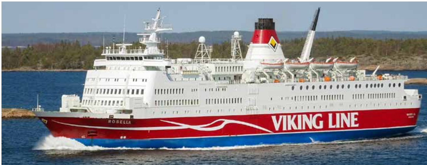
Rosella har sålts till Grekland.