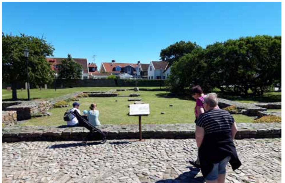
Nedan: S:ta Thoras kyrka, Torekov.