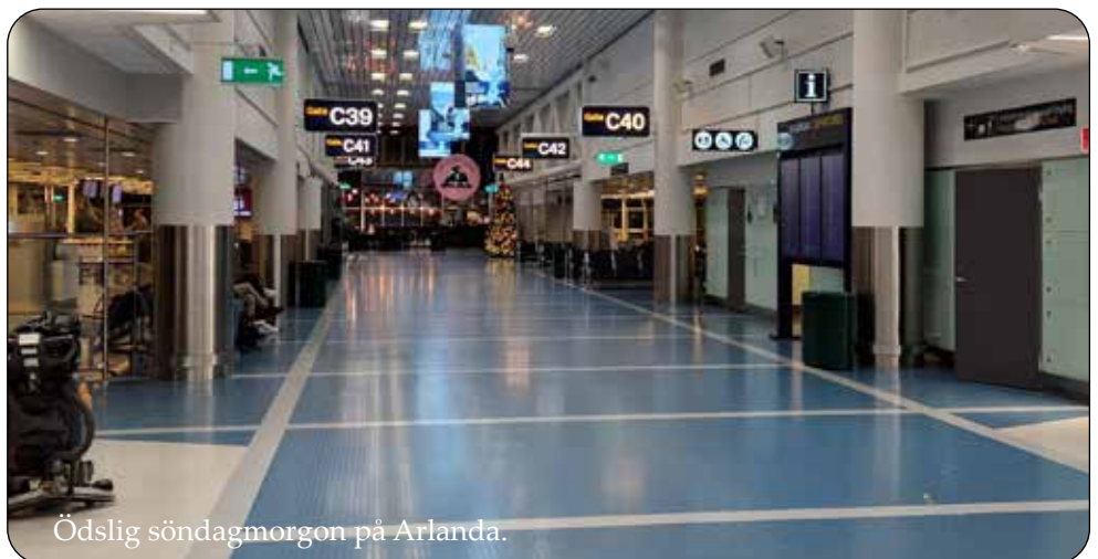
Ödslig söndagmorgon på Arlanda.

Efter incheckning av bagage och vi passerat säkerhetskontroll åt vi frukost. Varför ligger alltid "Gaten" man skall flyga från längst bort på flygplatsen?