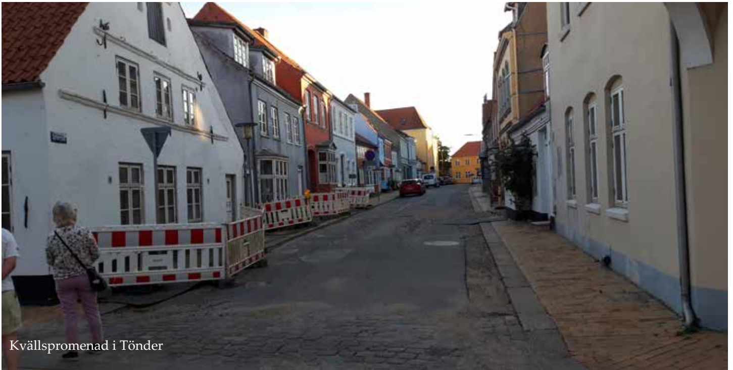
Kvällspromenad i Tönder