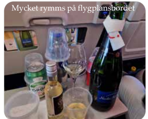
Mycket rymms på flygplansbordet