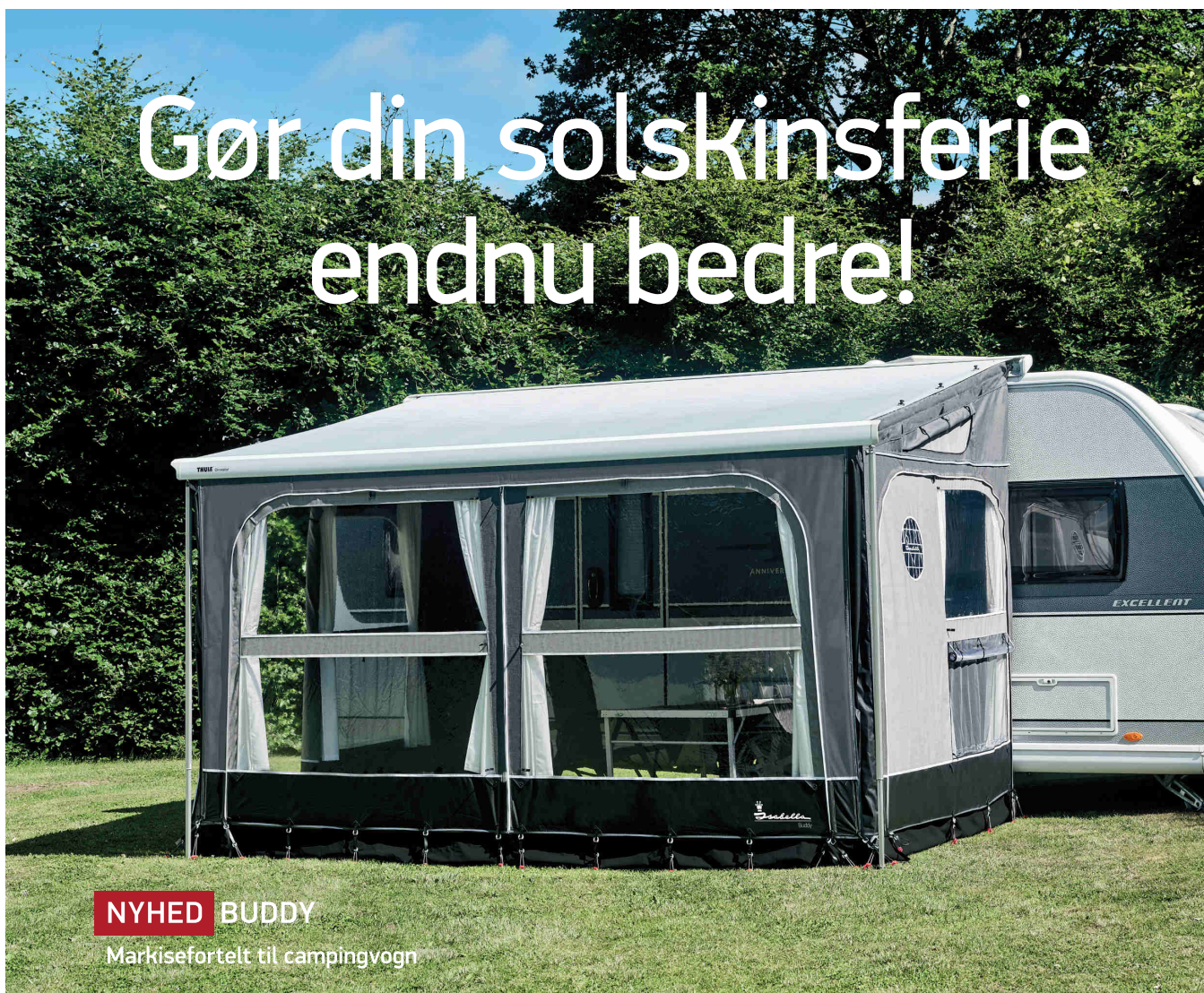
NYHED BUDDY Markisefortelt til campingvogn