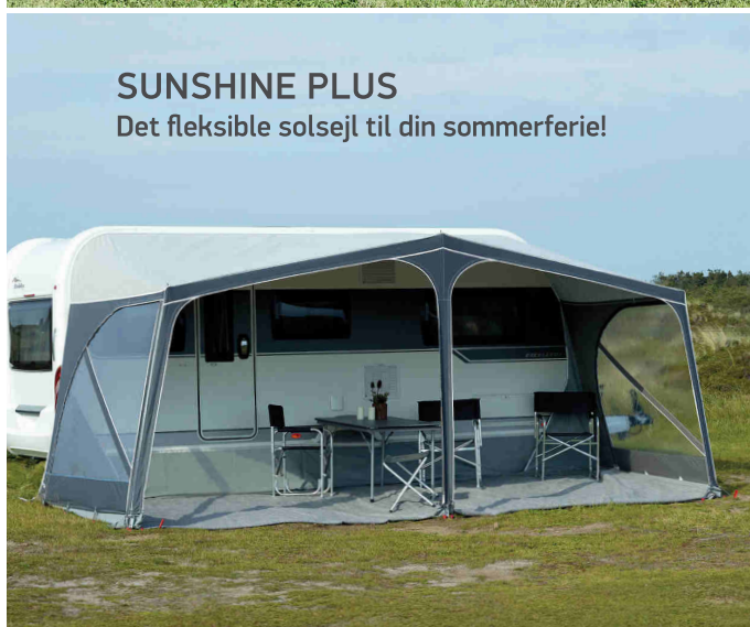
SUNSHINE PLUS Det fleksible solsejl til din sommerferie!