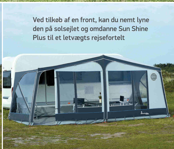
Ved tilkøb af en front, kan du nemt lyne den på solsejlet og omdanne Sun Shine Plus til et letvægts rejsefortelt